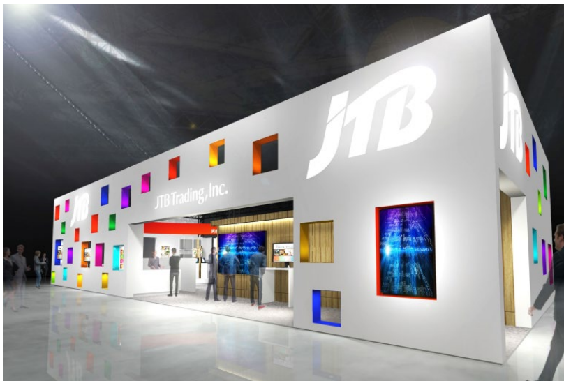
写真はすべてイメージです。

今年は、テーマ「New normal～これからの常識～」のもとに、宿泊業界が直面する課題解決のご提案をいたします。また、当日は「見て」「触って」「体験」いただける商材・サービスをご用意いたします。ご来場の際は、ぜひ弊社ブースにお立ち寄りいただきたくご案内申し上げます。