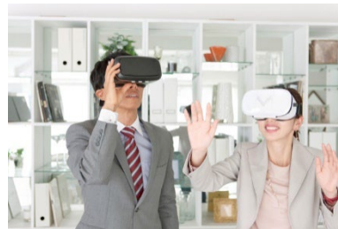
客室改装提案の VR 体験

詳しい展示商品の概要は、当社サイト「PROSPE」にてご覧いただけます。 (2024年2月～)